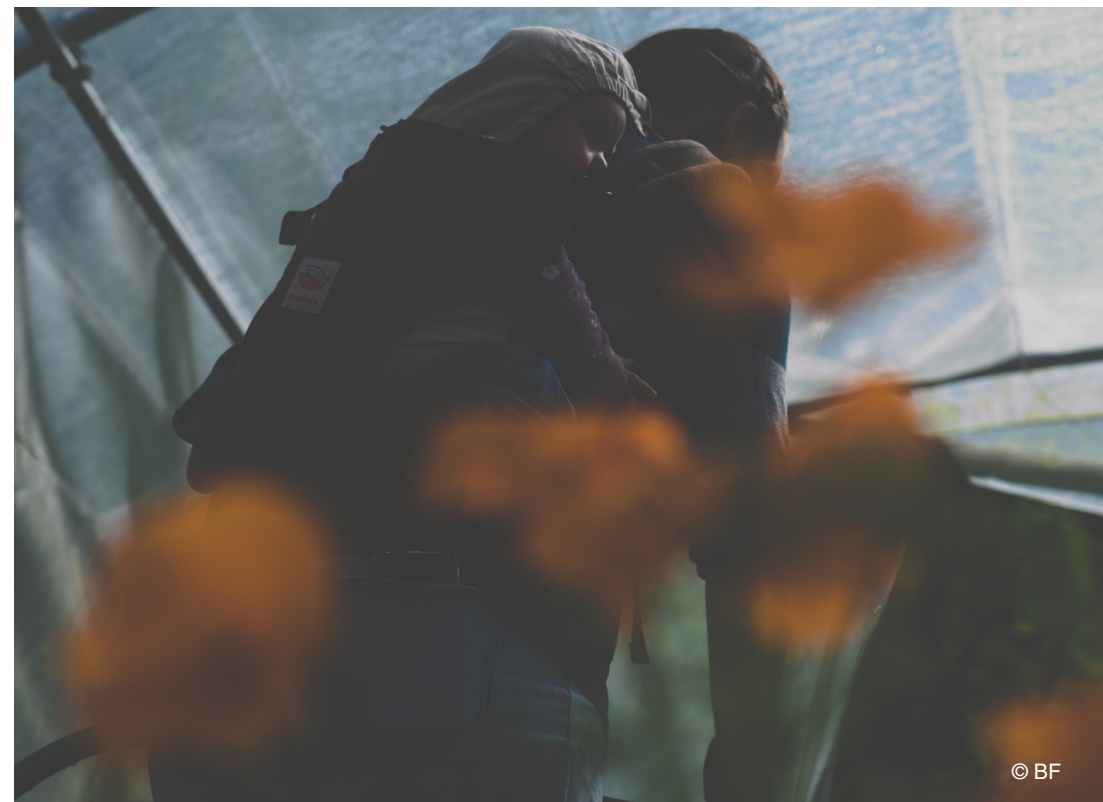
« Elles la font vivre, cette vallée qui leur étire les cils. »