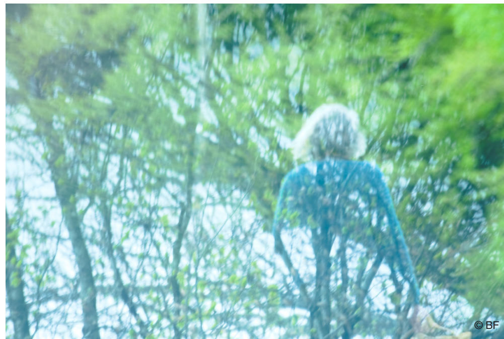
« Elles viennent d'ailleurs. »